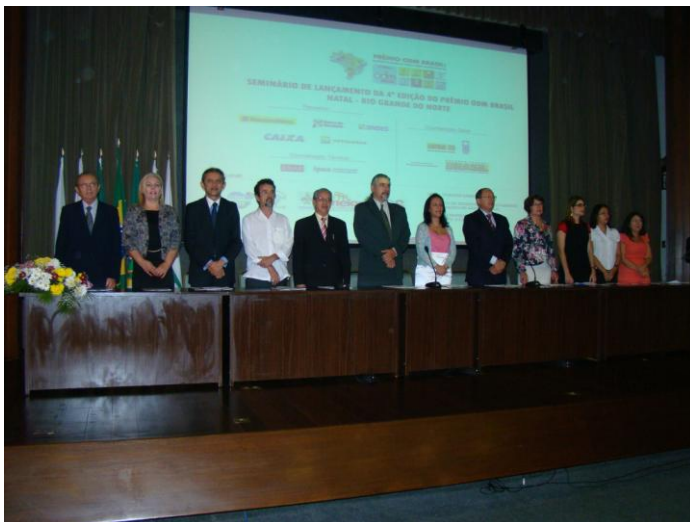
Mesa de Abertura